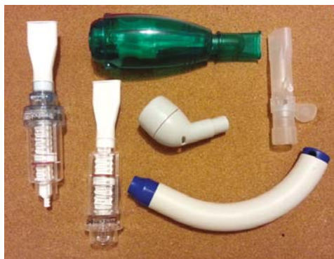
Obrázek 6 Dechové pomůcky

Bolest na hrudníku a pocit tíhy na hrudním koši může způsobovat zvýšené napětí svalů hrudníku, zablokování skloubení hrudního koše a snížená protažitelnost měkkých tkání hrudního koše. V rámci rehabilitační léčby vám fyzioterapeut měkké tkáně hrudníku ošetří a naučí vás i techniky, pomocí kterých si budete moci uvolnění svalů a mobilizaci skloubení hrudního koše provádět v rámci autoterapie sami, kdykoli budete potřebovat (Obrázek 8).