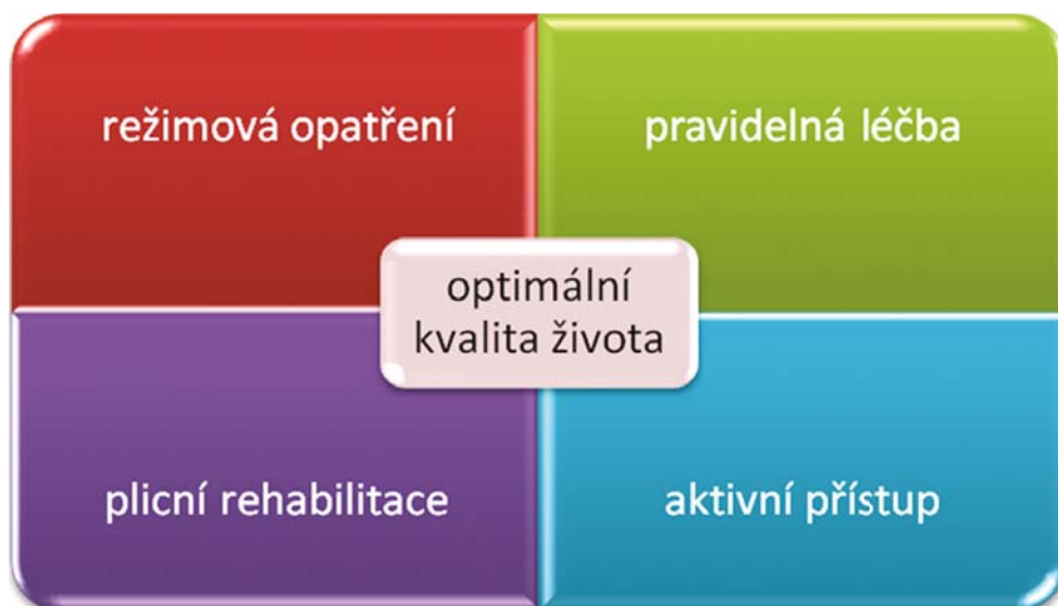
Obrázek 1 Komplexní přístup pro léčbu dechových obtíží

Milá pacientko, milý paciente, pokud se léčíte pro chronické respirační onemocnění, jako je například chronická obstrukční plicní nemoc, bronchiální astma, intersticiální plicní onemocnění, opakované a časté záněty průdušek a plic, může být pro vás přínosná kromě farmakologické léčby i léčba pomocí plicní rehabilitace. Plicní rehabilitace vám může napomoci lépe zvládat vaše onemocnění, snížit jeho projevy a vést ke zlepšení kvality života (Obrázek 1).