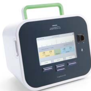
Obrázek 7 Přístroj pro podporu expektorace