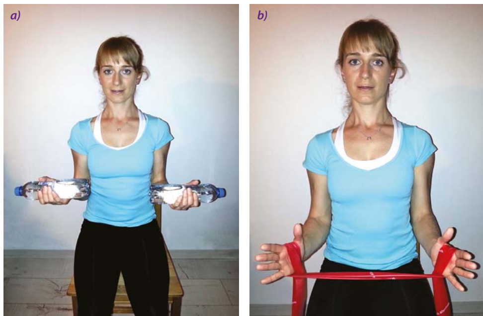
Obrázek 9 Silový trénink s využitím (a) PET lahví, (b) pružného pásu

pro vás optimální a nejvíce prospěšná. Mezi nejčastější pohybové aktivity pro vytrvalostní trénink patří chůze, severská chůze, jízda na kole, jízda na rotopedu nebo jízda na krosovém trenážeru. Fyzioterapeut vás naučí, jak pohybové aktivity vykonávat a jak si je zaznamenávat a vyhodnocovat. Jednou z lehce dostupných možností je sledování počtu kroků za den pomocí krokoměru (Obrázek 10) nebo pomocí aplikace nainstalované do vašeho mobilního telefonu. Optimální počet kroků za den konzultujte s vaším lékařem nebo fyzioterapeutem. Postupně můžete navyšovat počet kroků tak, aby jich bylo až 10 000 za den. Nicméně je vždy nutné vhodný počet kroků za den stanovit individuálně dle vašeho aktuálního zdravotního stavu.