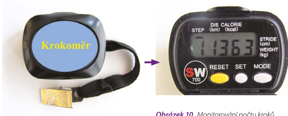
Obrázek 10 Monitorování počtu kroků