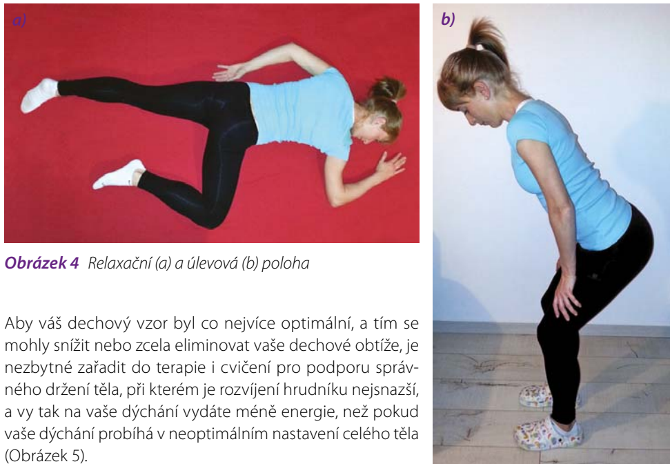
Obrázek 4 Relaxační (a) a úlevová (b) poloha

Dechová cvičení vám také pomohou zlepšit vaši inhalační techniku, aby byla správná, a aby tak byla inhalační léčba pro vás co nejvíce účinná. Pro snížení výskytu dechových obtíží jsou také velmi důležitá relaxační dechová cvičení a nácvik jednotlivých úlevových poloh (Obrázek 4).