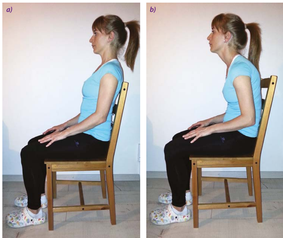
Obrázek 5 Vhodná (a) a nevhodná (b) poloha pro dýchání

expektorace. Cílem je odkašlat lehce, snadno a efektivně. Můžete k tomu využít techniky pro hygienu dýchacích cest neboli drenážní techniky. Patří mezi ně například autogenní drenáž a aktivní cyklus dechových technik. Aktivní cyklus dechových technik se skládá ze tří samostatných technik – cvičení na zvýšení rozvíjení hrudníku, kontrolního dýchání a techniky silového výdechu. Tyto techniky lze mezi sebou různě kombinovat. Kontrolní dýchání podpoří relaxaci a napomůže získat kontrolu nad vaším dýcháním po odkašlání. Cvičení na zvýšení rozvíjení hrudníku usnadní nádechovou fázi kašle, naopak technika silového výdechu (huffing v kombinaci s kontrolním dýcháním) pomůže posunout hleny do hlavních dýchacích cest, odkud je lze lehce odstranit. Pro usnadnění expektorace lze použít i dechové pomůcky. Pari O-PEP, RC-cornet, flutter, acapella a shaker jsou dechové pomůcky s vibrací, která napomůže snazšímu odlepení hlenu ze stěny dýchacích cest a k posunu hlenu v dýchacích cestách tak, aby mohl